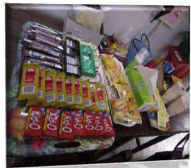
101 年 3 月 18 日教檢考生服務隊，感謝潘文富老師、張威克老師蒞臨加油打氣，預祝大家金榜題名！