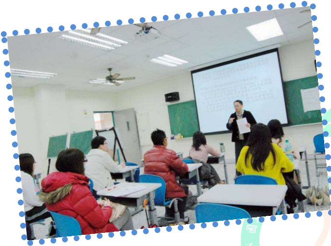
← 兒童發展與輔導試題分析 / 高金成老師