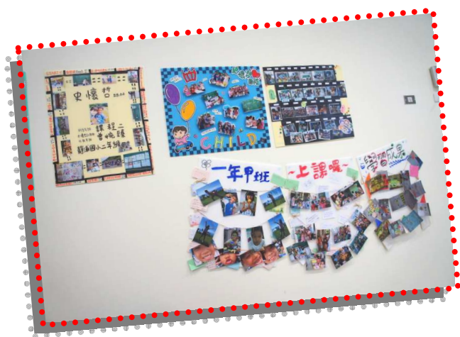
史懷哲會場成果佈置