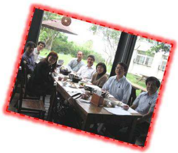
100 學年度第 2 學期教育實習輔導委員會，感謝委員蒞臨指導。