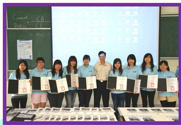
課程系周主任頒發教育部史懷哲服務證明